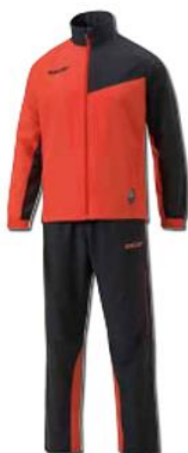
Freizeitanzug Art. Nr. 6475