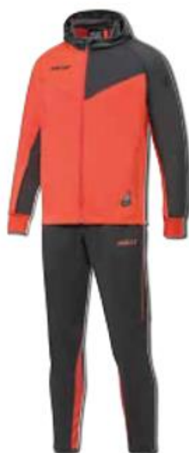
Trainingsanzug Art. Nr. 6025