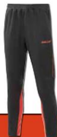
Trainingshose Art. Nr. 6275