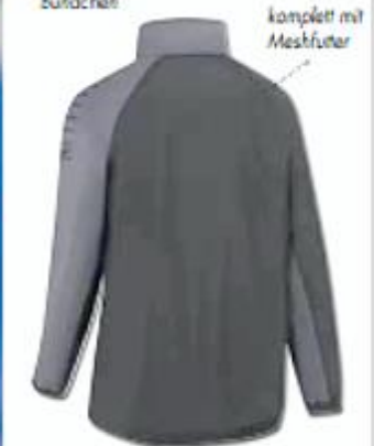
komplett mit Meshfutter

Regenjacke »sallerUltimate« Wasserdichte Jacke mit 2000 mm / Wasser- säule und getopften Nähten. Ideal bei starkem Regen. Regulierbare Kapuze für beste Sicht. Jacke komplett mit Meshfutter gefüttert für maximale Atmungsaktivität. Zwei seitliche Taschen mit Reißverschluss. Regulierbare Armbündchen. Material: 100% Polyester / Rib Stop Farben: 565 schwarz-anthrazit Art-Nr.: 7575