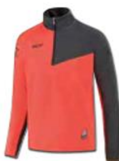
Trainingstop Art. Nr. 6175